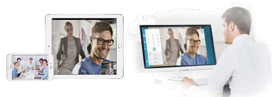
Yealink PC/Mobile Softclient