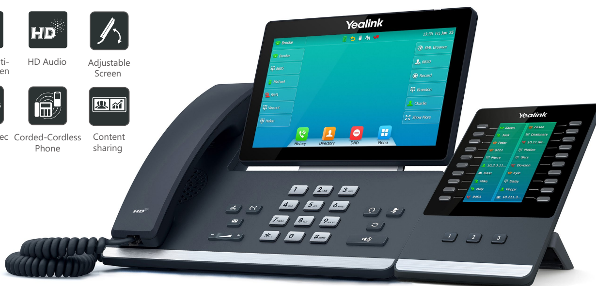
SIP-T57W + EXP50