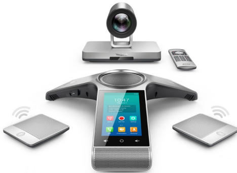
Yealink VC800 Phone