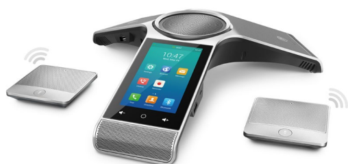
CP960 + CPW90