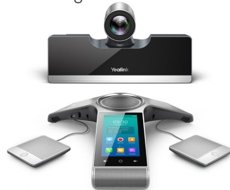
Yealink VC500 Phone