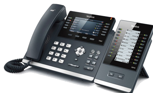
SIP-T46S + EXP40